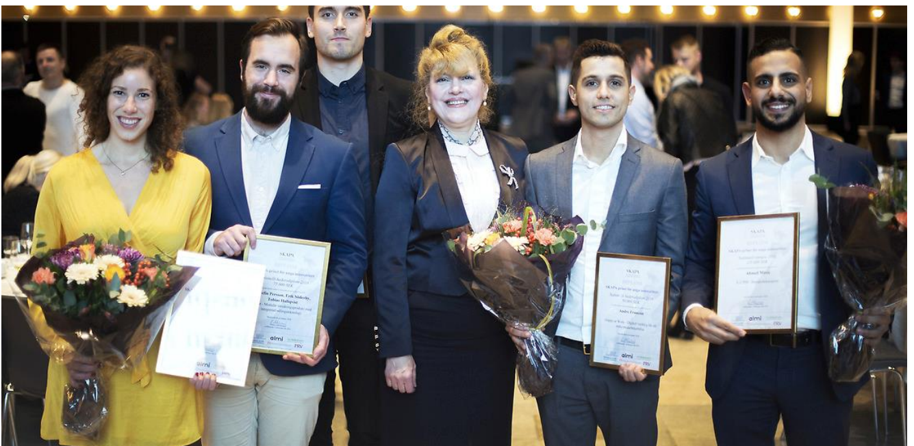
Bild från SKAPA Innovationsgala den 8 november 2018.

Stiftelsen delar årligen ut SKAPA- priser både nationellt och regionalt samt SKAPA-priset för unga innovatörer.